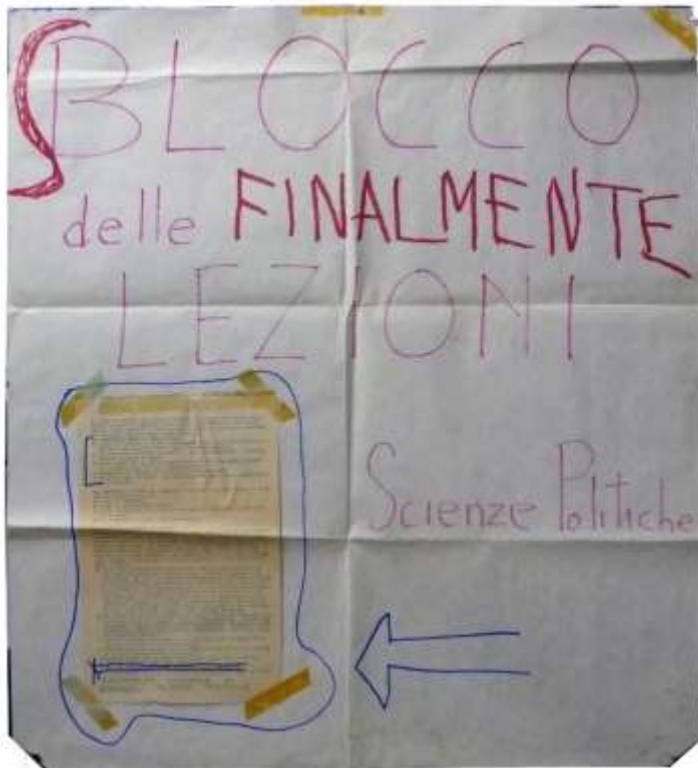
10 (S)Blocco delle lezioni, con incollato un volantino, tatzebao, 75 x 75 cm.