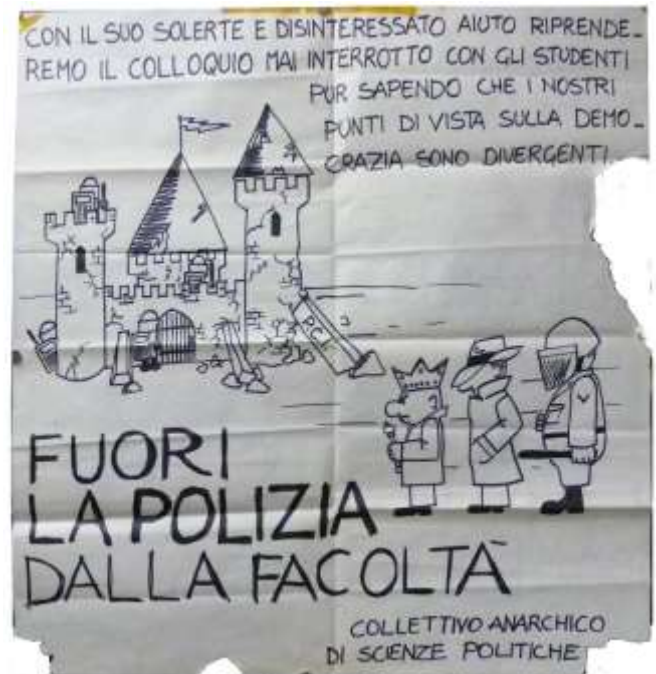
13 Col suo solerte e disinteressato aiuto...Collettivo anarchico di scienze Politiche, s.d., tatzebao, 76 x 76 cm.